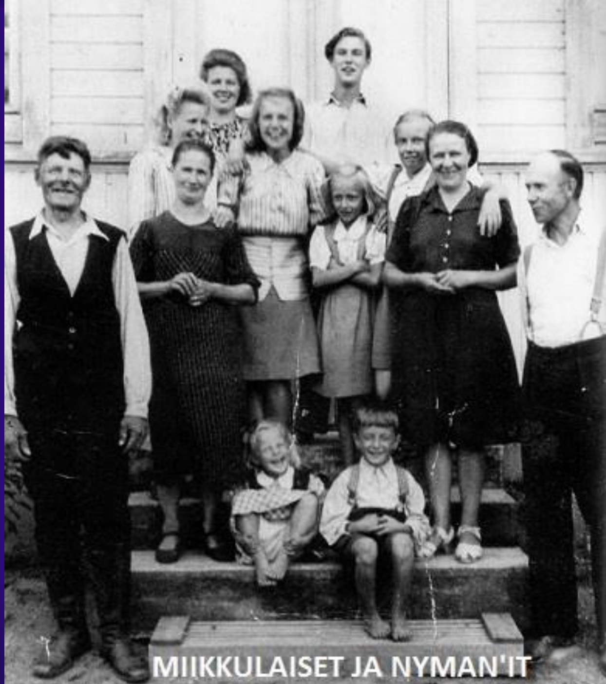
MIKKULAISET JA NYMAN'IT